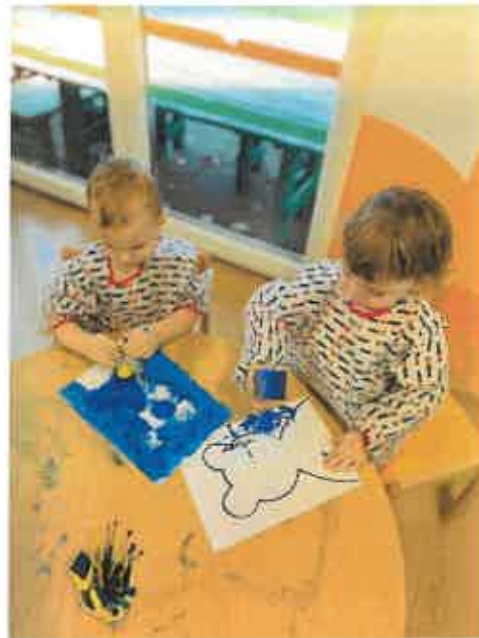
Šikovné ručičky – poznávanie farieb