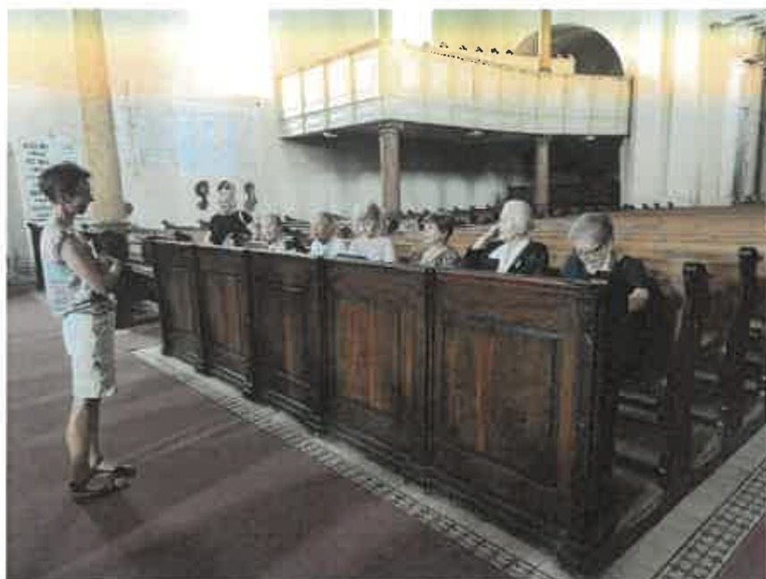
Obr. 7 – Koľko lásky sa zmestí do krabice od topánok