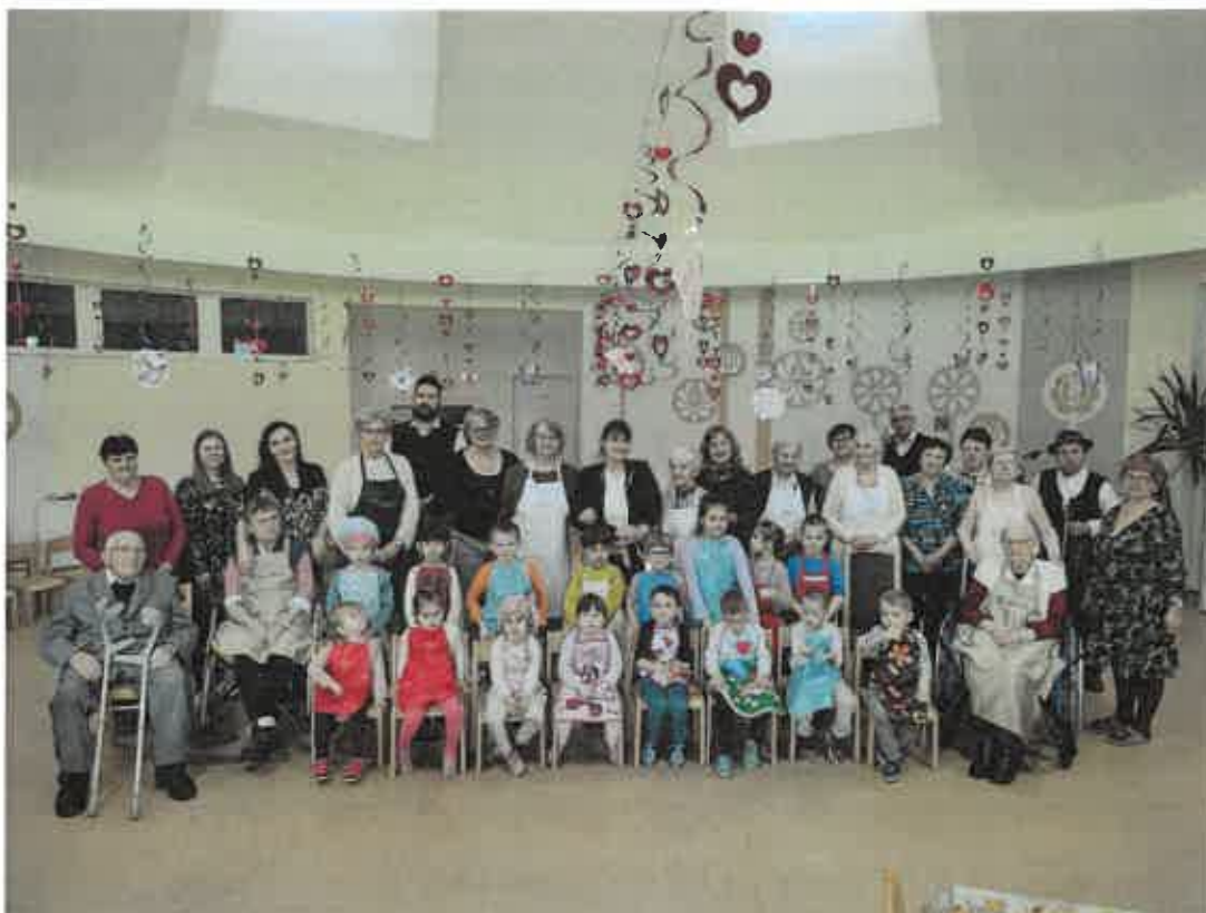
Obr. 1,2,3 – Spájanie generácie _ Reformovaná MŠ Csillag Komárno, Reformovaná MŠ Napraforgó Pribeta